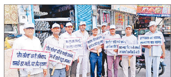
जीद। दुकानदारों को जागरूक करते संस्था सदस्य।