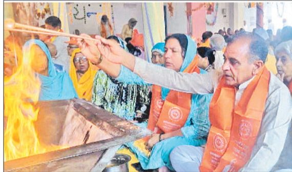
जीद। यज्ञ में आहुति डालते हुए।