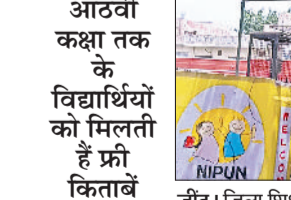
जींद। जिला शिक्षा अधिकारी कार्यालय।

निशुल्क किताबें शिक्षा विभाग की ओर से विद्यार्थियों को भेजी जाती हैं। नया सत्र शुरू हो चुका है। ऐसे में विभाग की ओर से राजकीय स्कूलों में पहली से आठवीं कक्षा के विद्यार्थियों के लिए किताबें भेजी जा रही हैं। वहीं नौवीं से 12वीं कक्षा में राजकीय स्कूलों में शिक्षा विभाग की ओर से एनसीईआरटी या बोर्ड द्वारा प्रस्तावित किताबें ही लगवाई जाती हैं। इसके अलावा निजी स्कूलों में भी शिक्षा विभाग की ओर से