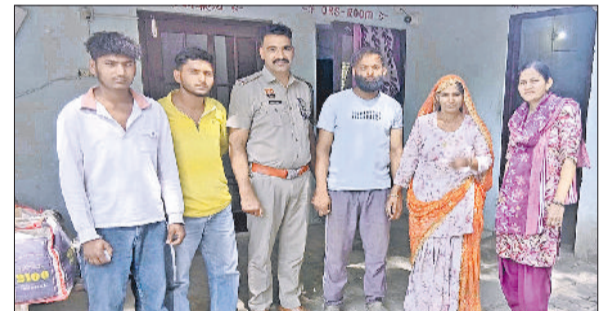
जीद। महिला को उसके परिजनों को सौंपते पुलिसकर्मी।