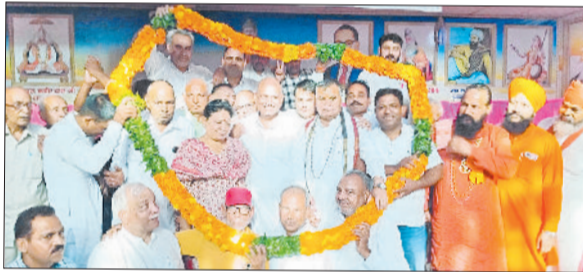
जुलाना। वार्ड पांच में राज्यसभा सांसद कर्मवीर बौद्ध का स्वागत करते लोग।

जुलाना कस्बे के वार्ड नंबर पांच में कांग्रेस के राज्यसभा सांसद कर्मवीर बौद्ध के पहुंचने पर कार्यक्रम का आयोजन किया। इस दौरान स्थानीय लोगों और पार्टी कार्यकर्ताओं ने फूल मालाओं से उनका स्वागत किया। कार्यक्रम में सोनीपत से सांसद सतपाल ब्रह्मचारी और बरोदा से विधायक इंद्रराज नरवाल भी मौजूद रहे। कार्यक्रम को संबोधित करते हुए राज्यसभा सांसद कर्मवीर बौद्ध ने केंद्र की भाजपा सरकार पर तीखा हमला बोला। उन्होंने कहा कि भाजपा देश में विकास की बजाय जाति और धर्म की राजनीति को