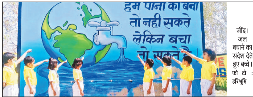
जीद। जल बचाने का संदेश देते हुए बच्चे।