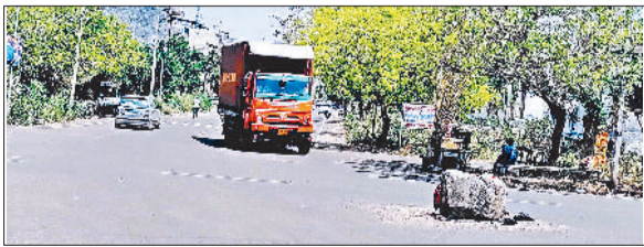
जीद। सेक्टरों के मोड़ जहां चौक बनवाने की मांग है।

सेक्टर छह, सात और नौ में तीन जगह लोगों की चौक बनवाने की मांग है। इस साल एक जनवरी को सेक्टर आठ व नौ के मोड़ पर किसान चौक का उद्घाटन डिप्टी स्प्रीकर द्वारा किया गया था। इससे एक ओर जहां सेक्टर में सुदृढ़ता बढ़ी है वहीं चौक बनने पर सड़क हादसों में भी कमी आईगी। लगभग दो साल पहले इसी मोड़ पर धुंध के चलते कार तेज गति से एक घर में घुस गई थी। इसमें गनीमत रही कि कार चालक को थोड़ी बहुत ही चोट लगी थी। इसके बाद सेक्टरवासियों ने चार