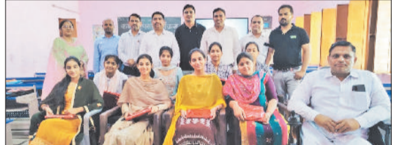
जीद। सांग प्रस्तुत करने वाली छात्राओं को सम्मानित करते हुए।