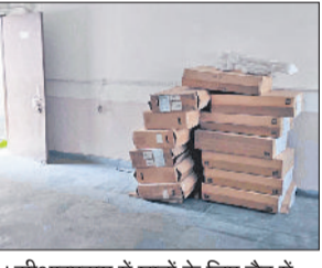
जींद। सीआरएसयू में छात्रों के लिए लैब में रखे कंप्यूटर।

चौधरी रणबीर सिंह विश्वविद्यालय के शिवाजी छात्रावास में पिछले लगभग दो वर्षों से बंद पड़ी कंप्यूटर लैब को आखिरकार छात्रों की आवाज उठने के बाद खोल दिया गया है। लंबे समय से उपेक्षा का शिकार बनी यह लैब विश्वविद्यालय प्रशासन की कार्यप्रणाली पर कई गंभीर सवाल खड़े कर रही थी। छात्रों ने जब इस मामले को उठाया और ज्ञान सौंपा तो प्रशासन हरकत में आया तथा बंद लैब की साफ-सफाई और व्यवस्था दुरुस्त करने का कार्य शुरू किया गया। जानकारी के अनुसार शिवाजी छात्रावास परिसर में स्थापित इस