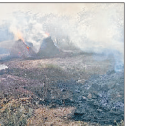
लिया। सूचना पाकर सदर थाना पुलिस तथा फायर ब्रिगेड की गाडियों मौके पर पहुंच गई और ग्रामीणों के सहयोग से आग पर काबू पाया। जब तक आग पर काबू पाया जाता तब तक 60 एकड़ फाने तथा दर्जनभर बिटोड़े जल चुके थे। ग्रामीणों ने बताया कि आग खेतों में फानों में देखी गई थी। कुछ देर में विस्फाल रूप धारण कर लिया और गांव तक बढ़ आई। गनीमत यह रही कि फायर ब्रिगेड ने मौके पर पहुंच कर आग पर काबू पा लिया।

गांव खुंगा खेतों में रविवार शाम को अचानक आग भड़क उठी। भीषण गर्मी तथा हवा तेज होने के कारण आग तेजी से फैलने लगी। जिसने गांव की तरफ रूख कर दिया। खेतों में आग को तेजी से फैलते देख ग्रामीणों ने आग पर काबू पाने की कोशिश की लेकिन आग तेजी से गांव की बढ़ने लगी और बिटोड़ों को अपनी चपेट में ले