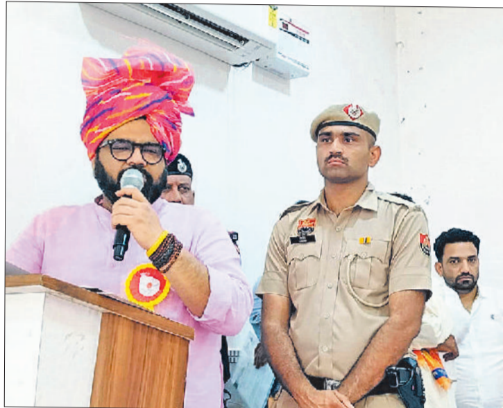
जीद। कार्यक्रम को संबोधित करते राज्यसभा सांसद कार्तिकेय शर्मा।

कार्तिकेय शर्मा ने ज्ञान गंगा केंद्र के लिए की 10 लाख देने की घोषणा