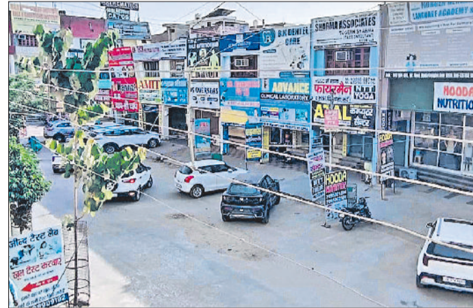
जींद। दोपहर के समय खाली नजर आ रही हुडा मार्केट।